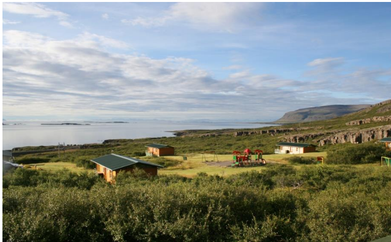
Mynd 1: Frístundabyggð