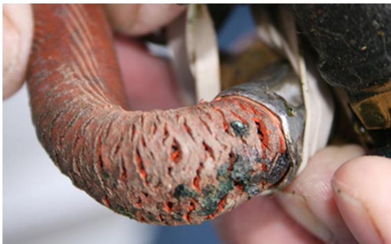
Mynd 7 Morkin gasslanga sem er orðin hættuleg.

Eins og fram hefur komið er notkun á gasi í frístundahúsum algeng til ýmissa nota, mjög mikilvægt er því að frágangur þessara tækja sé réttur og þessum tækjum og búnaði sé viðhaldið. Þar sem gas er geymt eða þar sem notkun gass fer fram innandyra er mikilvægt að setja upp gasskynjara og huga vel að út loftun í þeim rýmum þar sem kútar eru geymdir. Slíka útloftun er heppilegast að útfæra með þar til gerðum lofttúðum sem settar eru neðan til í slíkum rýmum. Öll gastæki s.s. eldavélar, ísskápar, hitarar og þess háttar skulu búin logavara sem lokar fyrir aðstreymi á gasi ef gasloginn slokknar. Sjá í þessu sambandi reglugerð um tæki sem brenna gasi nr. 727/2018. Slöngur milli tækis og gaskúta skulu vera sérstaklega gerðar fyrir gas (yfirleitt appelsínugular að utan en svartar að innan). Á þeim er framleiðsludagsetning tilgreind og framleiðendur gefa upp endingu á slöngunum sem yfirleitt er 3 – 5 ár við góðar aðstæður. Sé gúmmið í slöngunni farið að harðna eða springa skal slöngunni skipt út. Prófa má leka á lögnum með því að bera sápuvatn á slönguna. Ef loftbólur myndast eru lagnirnar óþéttar og skulu þær lagfærðar eða skipt um þær. Lekar gaslagnir geta skapað mikla eld- og sprengihættu. Allar gaslagnir sem eru lengri en 1,5 m ættu að vera fastar málmlagnir settar upp af fagfólki.