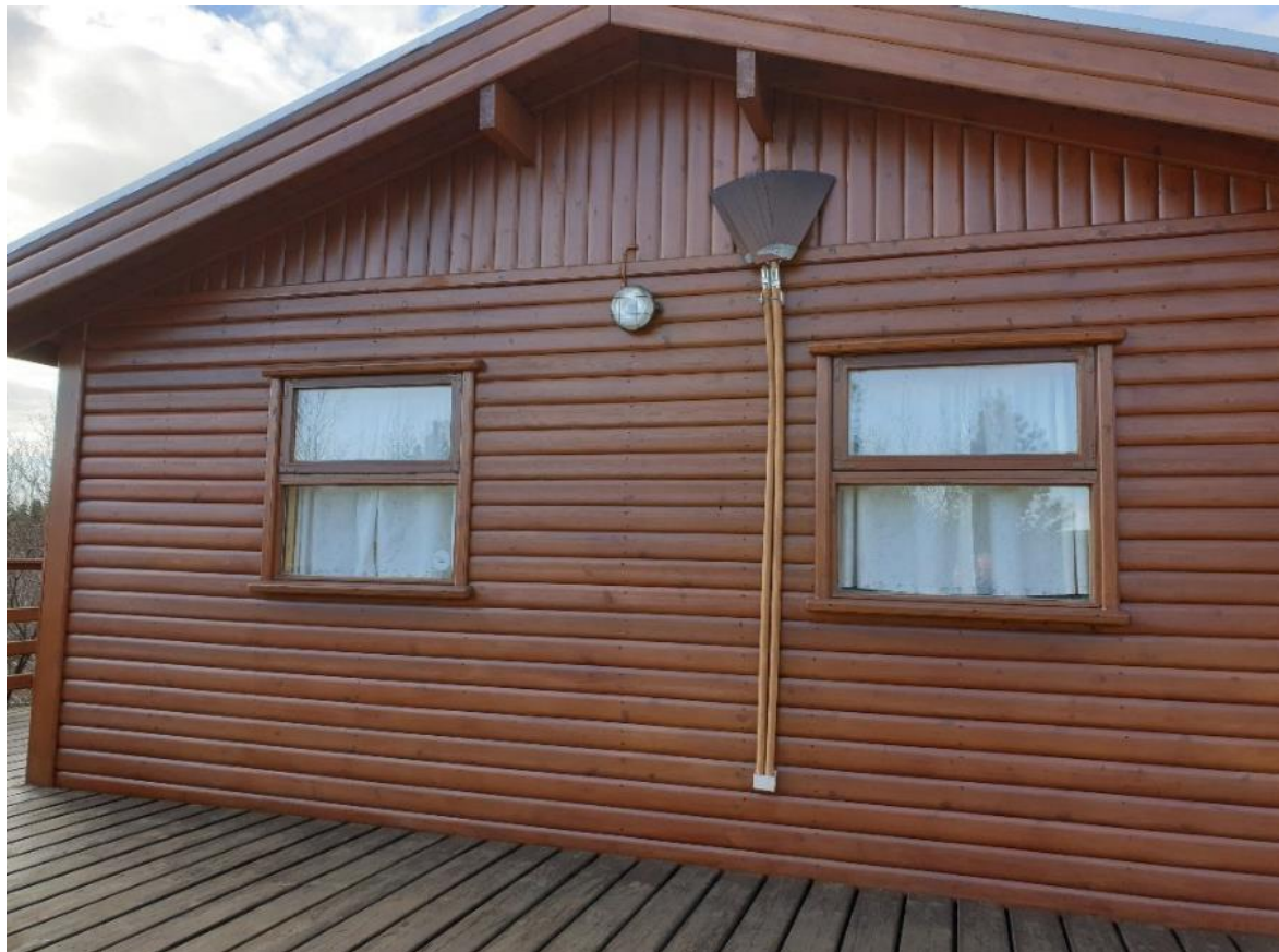
Mynd 2 Ábyrgð eigenda er mikil þegar kemur að brunavörnum.

Eigandi mannvirkis ber ábyrgð á að það fullnægi kröfum um brunavarnir sem settar eru fram í lögum um brunavarnir og reglugerðum, sbr. 1. mgr. 23. gr. laga um brunavarnir og 3. gr. reglugerðar um eldvarnir og eldvarnareftirlit nr. 723/2017. Eigandi og eftir atvikum forráðamaður mannvirkis ber ábyrgð á eigin brunavörnum, að þær séu virkar og haft sé reglubundið eftirlit með þeim. Séu breytingar gerðar á mannvirki þannig að gerðar eru nýjar eða auknar kröfur um brunavarnir í því, er skylt að fá til þess samþykki byggingarfulltrúa og jafnframt að gera viðeigandi ráðstafanir til að kröfum um brunavarnir sé fullnægt eftir breytingarnar. Áréttað er mikilvægi þess að eigendur frístundahúsa kynni sér þær kröfur um brunavarnir sem gilda um mannvirkið og lóð þess í samræmi við forsendur útgefins byggingarleyfis, enda er það á ábyrgð