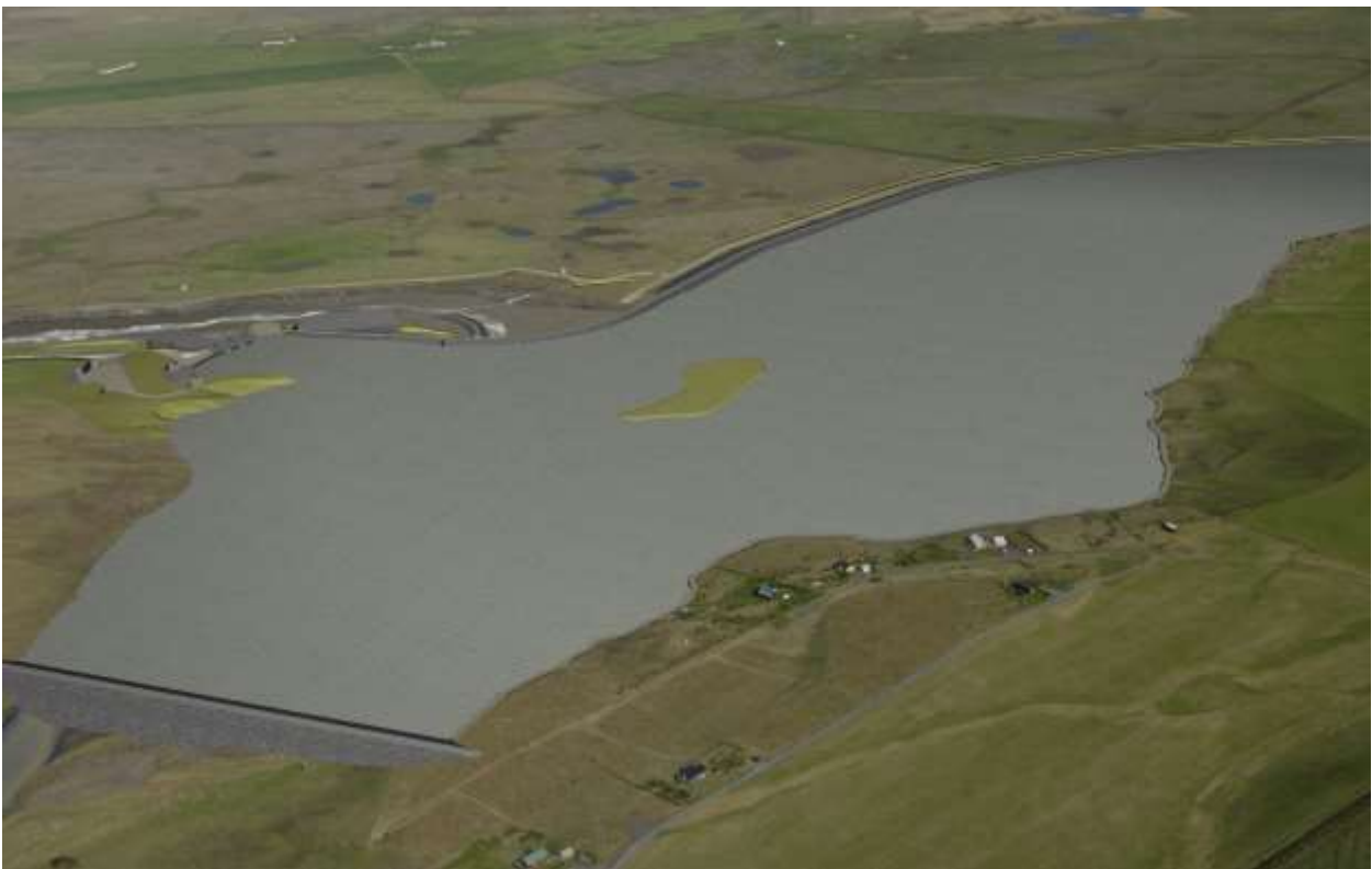
Mynd 5.2 Horft að inntaksmannvirk, lokumannvirkjum og stíflu á vesturbakka.