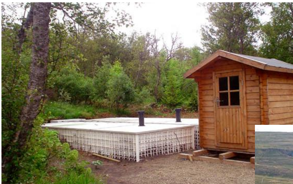
Hallormsstaður - 250 pe