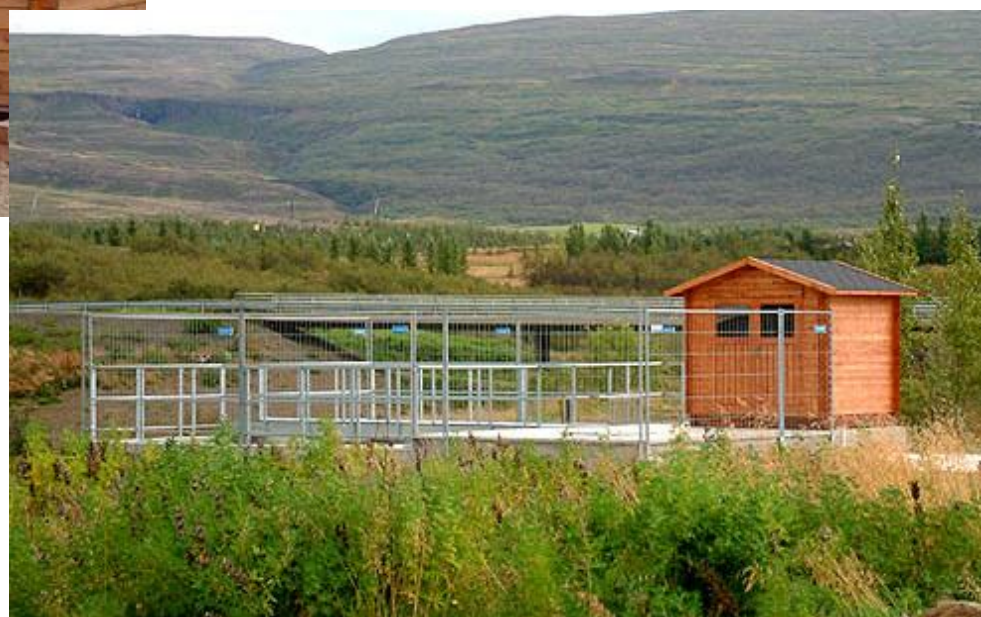
Einbúabla Eg. - 1000 pe