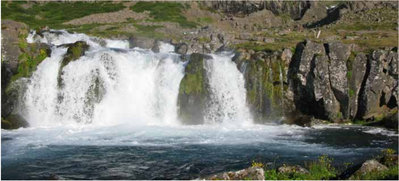
Neðsti fossinn í Dynjanda.