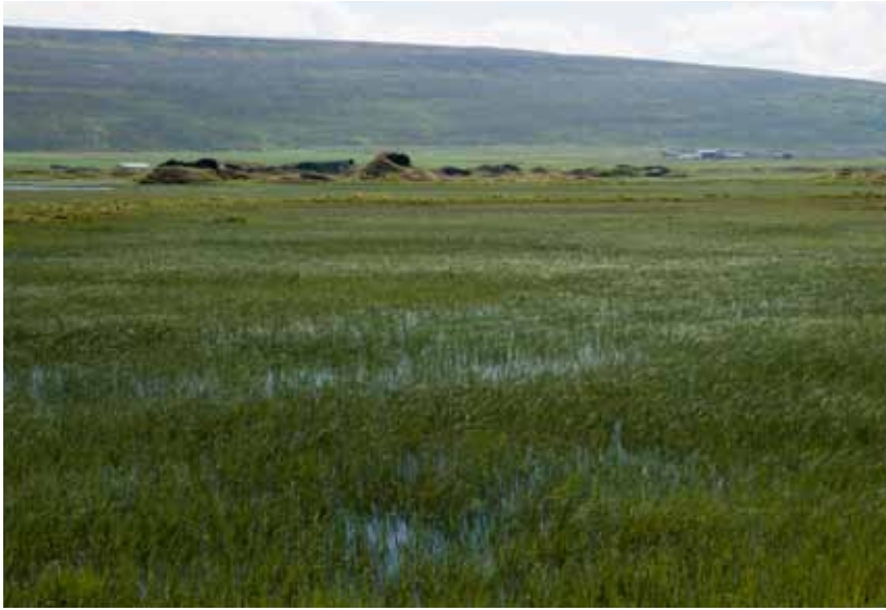
Vestmannsvatn í Reykjadal.