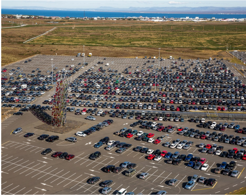
Langtímastæði, horft til austurs