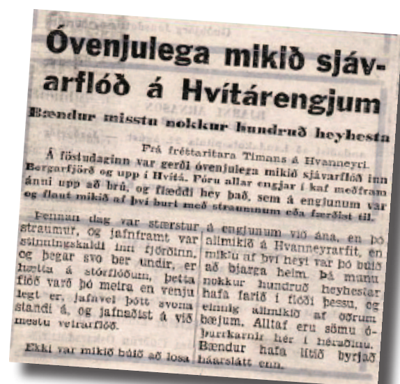
26. mynd: Frétt í Tímanum, þriðjudaginn 23. ágúst 1955.

Á föstudaginn var gerði óvenjulega mikið sjávarflóð inn Borgarfjörð og upp í Hvítá. Fóru allar engjar á kaf meðfram ánni upp að brú, og flæddi hey það, sem á engjunum var og flaut mikið af því burt með straumnum eða færðist til.