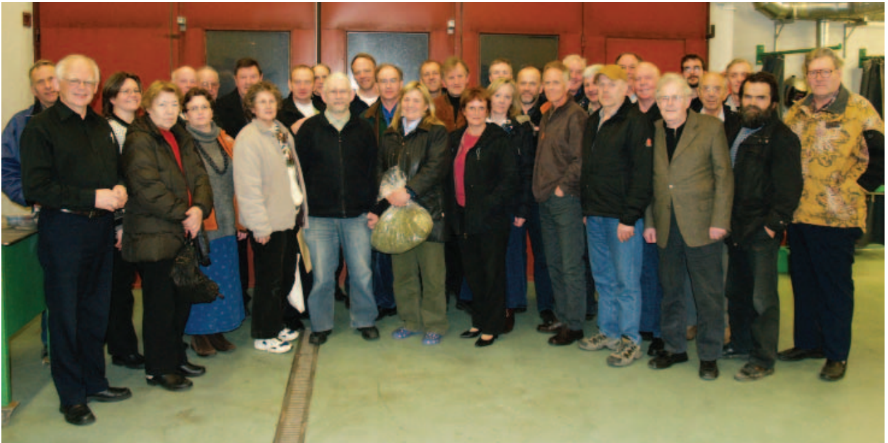
28. mynd: Þátttakendur á fróðleiksöflunarfundi þann 7. apríl 2010. (Ásdís Helga Bjarnadóttir).