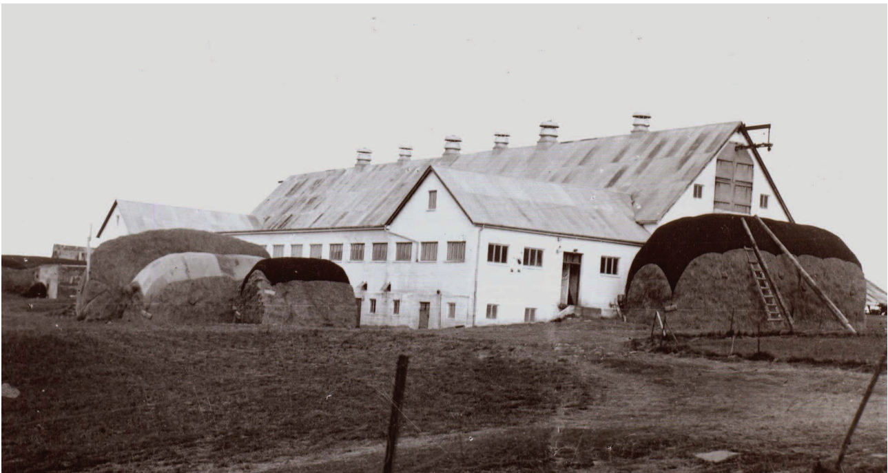
1. mynd: Heyfengur af Hvanneyrarengjum. Galtar við fjósið á Hvanneyri. Hlaðan rúmar ekki allan heyforðann, sem að stórum hluta var fenginn af engjunum. (Árni G. Eylands).

Nýtingarhættir engjanna breyttust nokkuð með tæknivæðingu á 20. öld. Fyrst á þann veg að