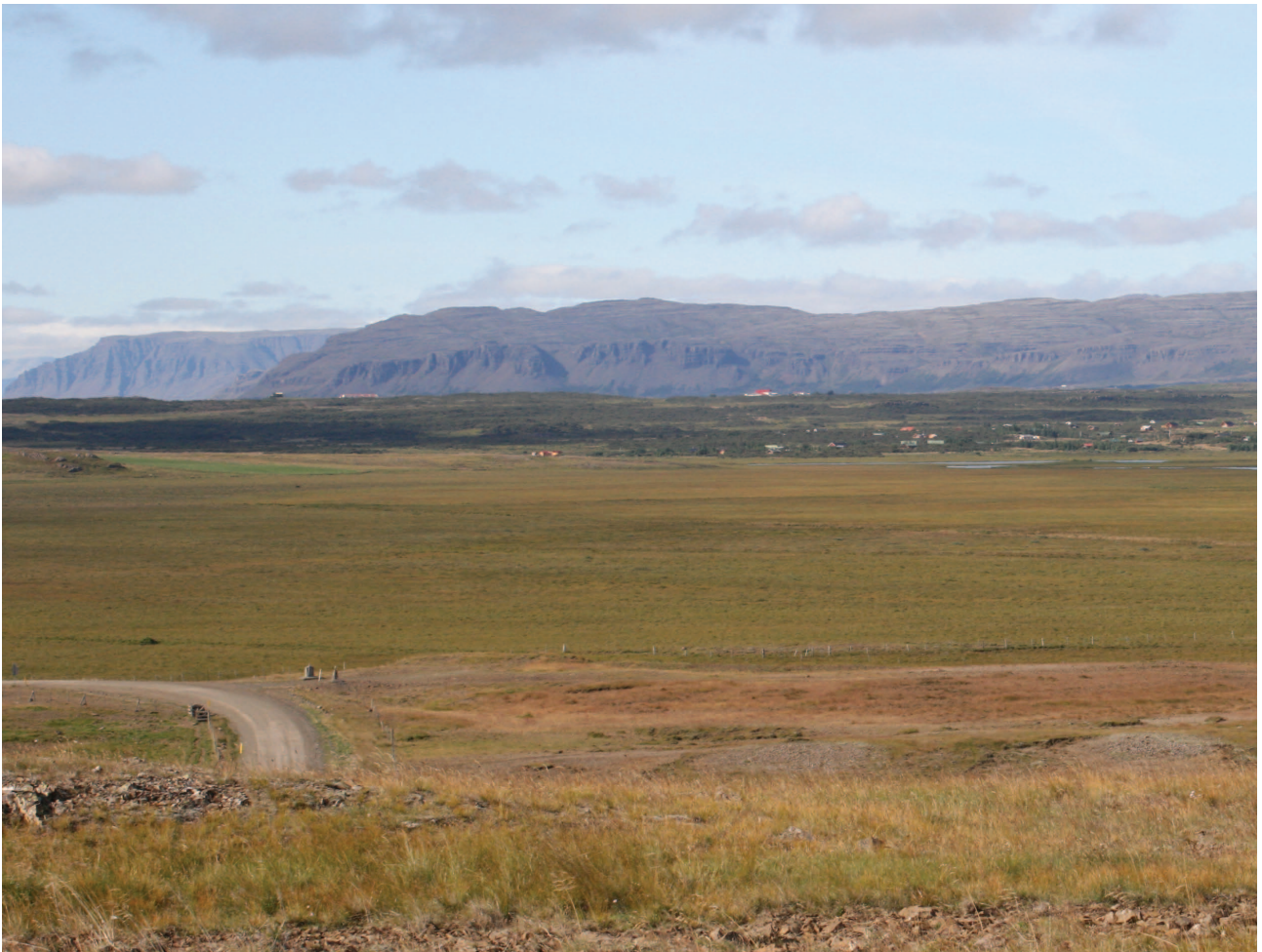
4. mynd: Fjölmargir sóttu slægjur um langan veg í Ferjubakkaflóa, jafnt úr Borgarnesi, af Mýrum og ofan úr Norðurárdal. Hér sést neðsti hluti Ferjubakkaflóa, ásamt Eskiholtsflóa.

Í Ferjubakkaflóanum var greiðslan oftast í forni vinnuskipta eða vöruskipta heldur en í peningum, að því best er vitað. Þó kom fyrir að greiðslan væri ein vínflaska eða svo (Þorkell Fjeldsted 2010).