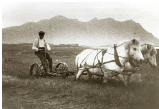
11. mynd: Slegið með hestasláttuvél á Hoanneyrarfit.