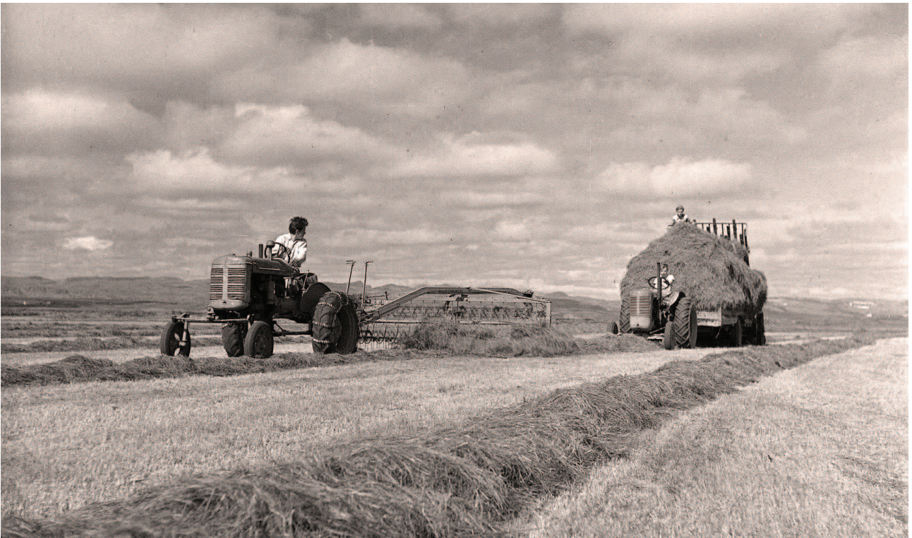
17. mynd: Heyskapur á Hvanneyrarfit um miðja síðustu öld: rakað saman með Farmal A, Case-dráttarvél með vagn og heyhleðsluvél fylgir á eftir. (Þorsteinn Jóseppson).

Heyband lagðist af eftir því sem dráttarvélar og bílar urðu almennari. Þær heimildir sem safnast hafa í þessu verkefni benda til að heyband hafi síðast verið notað þegar bændur frá Ferjubakka fóru inn í Nauthólma, neðst í Nordurá og slógu þar með orfi og ljá. Þetta var gert bæði árin 1965 og 1969. Heyið var bundið í bagga með hrosshársreipum og flutt í land á bát og svo á heyvagni heim. Seinna árið