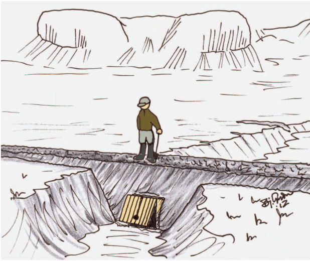
8. mynd a: Flóðgarðar með lokubúnaði í stökkum. (Bjarni Guðmundsson).