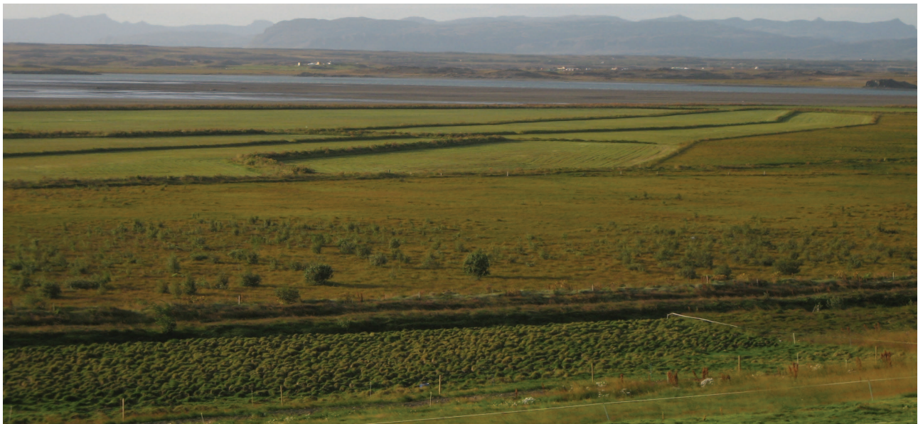
10. mynd: Flóð- og áveitugarðar á Hvanneyrarengjum. (Bjarni Guðmundsson).

a.m.k. bar ekki þann árangur sem vænst var. En önnur hliðarverkan þessara framkvæmda var að breyting varð á spildum og þar með örnefnum sem á þeim voru, því ekki voru skurðirnir alltaf grafnir eftir þeim keldum og stokkum sem áður voru og mörkuðu oft skil milli engjastykkja. Einnig gerðu skurðirnir það að verkum að keldur og lænur sem áður voru, hurfu og þar með örnefnin, sem og að tjarnir og bleytur í engjum þornuðu upp og hurfu.