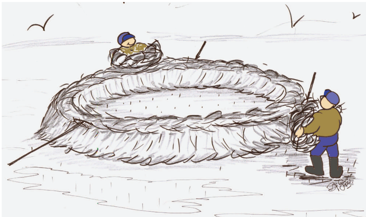
18. mynd: Sjólanir var það kallað þegar hey var sett upp í hring, en ekki í sátu. Sjólanir flutu síður og voru því notaðar í neyð, ef hætta var á að hey flæddu ef flóð hlupu á sig.