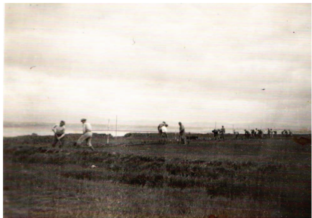
9. mynd. Hleðsla flóðgarða á engjum Hvanneyrar árið 1937. (Þórður Gíslason).

Á flestum þeirra engja sem hér er fjallað um, var ráðist í að grafa skurði þegar kom fram um og yfir miðja 20. öld. Þetta var gert, eins og annars staðar, í þeim tilgangi að þurrka engjarnar og gera þær aðgengilegri. Sums staðar bar það tilætlaðan árangur og samhliða breyttist gróðursamsetning. Annars staðar hafði það lítil eða engin áhrif, eða