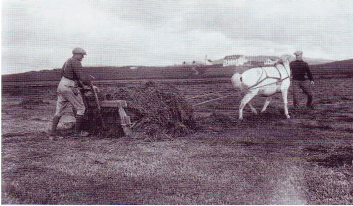
12. mynd: Hey tekið saman með ýtu á Hvanneyrarfit árið 1927.