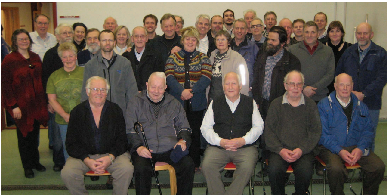
29. mynd: Þátttakendur á fróðleiksöflunarfundi þann 2. febrúar 2011. (Bjarni Guðmundsson).