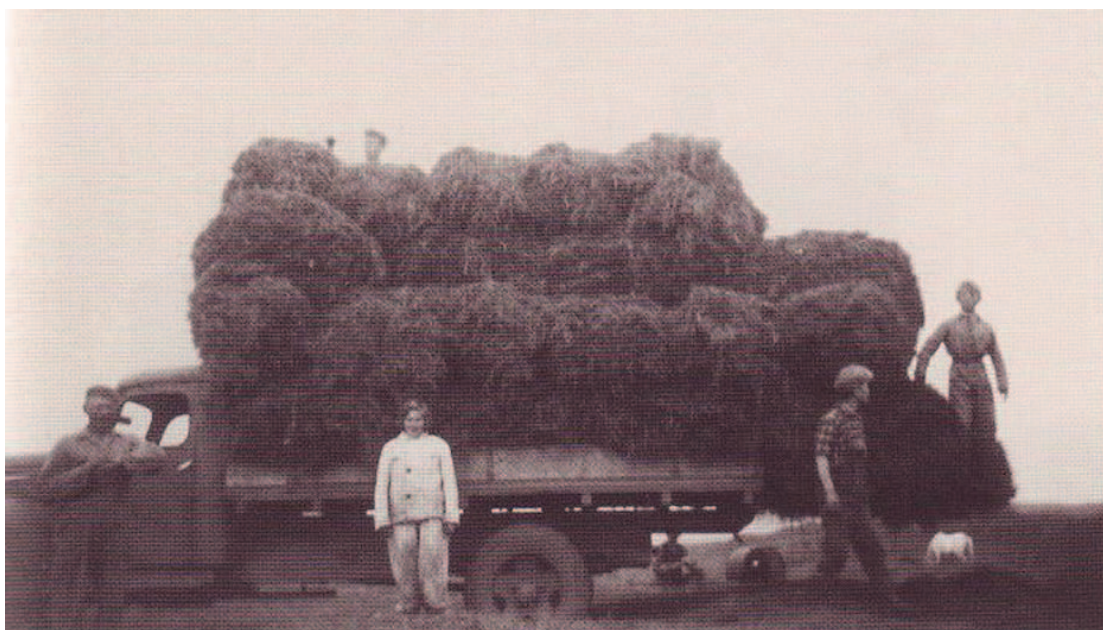
15. mynd: Votaband. Hey flutt á þurrkvöll á bíl úr Ferjubakkaflóa sumarið 1953. (Þórdís Ragnarsdóttir).

Það var kapphlaup að klára túnin sem fyrst til að komast á engjar sem fyrst áður en straumar stækkuðu þegar leið á sumar og þar með hætta