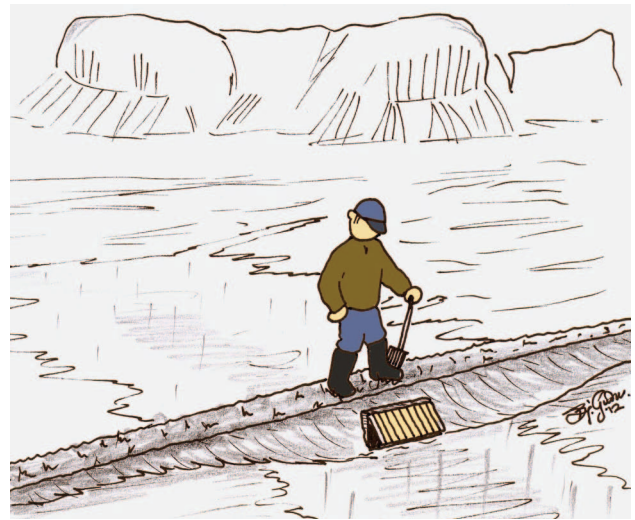
8. mynd b: Flóðgarðar með lokubúnaði í keldum.