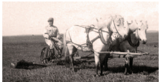
14. mynd: Teitur Daniélsson slær með hestasláttuvél með skúffu á Grímarstaðaengjum. Hestaklettur á Hvítárvalleingjum í baksýn. (Helga Daniélsdóttir).