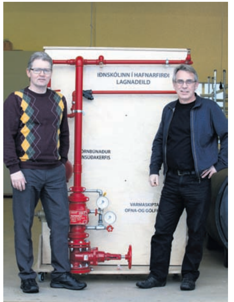
Iðnskólinn í Hafnarfirði og meistara- og sveinafélögin hafa unnið náð að kynningu á náminu fyrir ungt fólk og gert það með ýmsu móti. Í því sambandi hefur Íslandsmót iðngreina hlotið verðskuldaða athygli.

keppa ungir nemar eða sveinar við að leysa sérvalin verkefni innan ákveðins tímaramma. Þar gefst fólki tækifæri á að sjá hvernig fagmenn vinna, hvaða verkfæri eru notuð og hvaða efni er unnið með. Reglulega eru haldin Norðurlandamót iðngreina og árið 2007 eignuðust Íslendingar Norðurlandameistara í pípulögn.