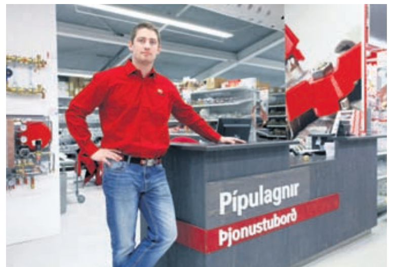
Enginn ætti að koma að tónum kofanum í verslunum Húsasmiðjunnar, að sögn Hannesar því vöruúrval sé mikið.

Að sögn Hannesar ætti því enginn að koma að tónum kofa hvað vöruúrval varðar. Húsasmiðjan bjóði alla flóruna bæði í pípulagnaefnum og hreinlætistökjum.