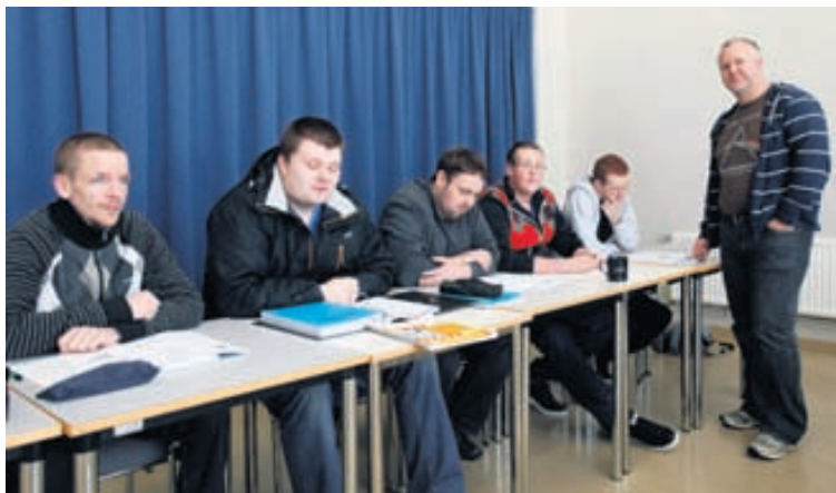
Nú eru 44 nemendur í pípulagninganámi við Iðnskólann í Hafnarfirði, þar af eru 17 nemendur að ljúka námi í vor.

Frá því að farið var að útskrifa nemendur úr skólanum með full sveinsréttindi hafa 135 nemar útskrifast. Núna eru 44 nemendur