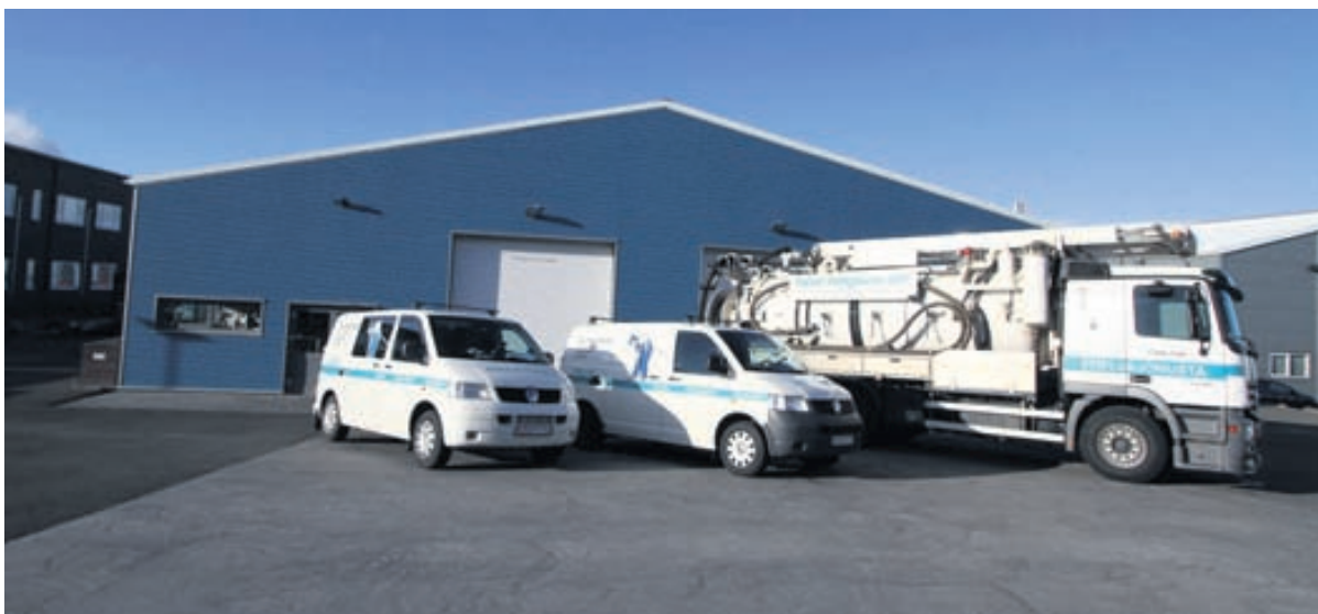
Stíflubjónusta Vals Helgasonar ehf. er á Gylfaflöt 13 í Reykjavík.

Stjani: 6592961- Ingvar: 8474980 fraendur@gmail.com