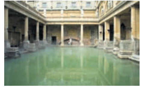
Rómversku böðin í bænum Bath á Englandi eru vinsæll áfangastaður ferðamanna. Böðin eru ákaflega vel varðveitt og gefa góða innsýn inn í menningarheim Rómverja.

Lengi vel varð engin þróun í pípulögnum eða allt þar til nútímaborgir fóru að byggjast upp á níttjándu öld. Þá hvöttu heilbrigðisyrkvöld til þess að fundið yrði upp kerfi til að losna við sorp og skolp en fram að því hafði slíku verið hent í nærliggjandi ár eða jafnvel bara út á götu.