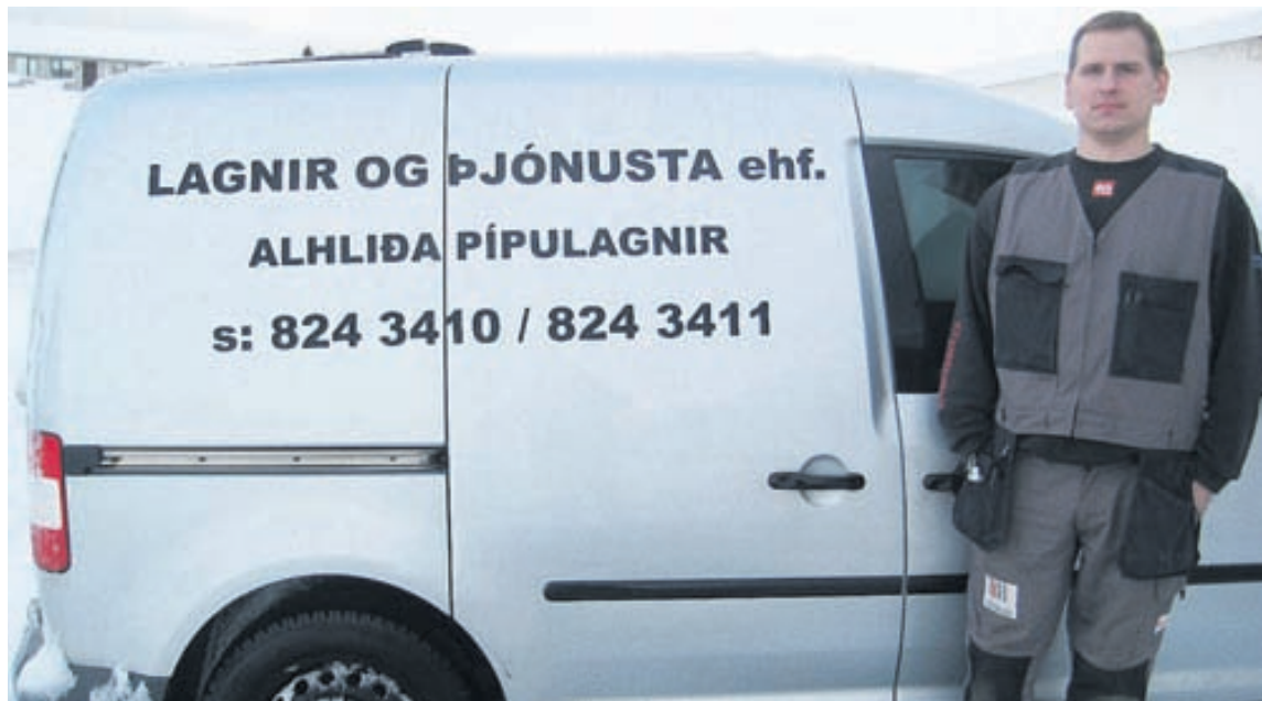
Lagnir og þjónusta ehf. sinna allri almennri pípuþjónungarþjónustu og stíflþjónustu.