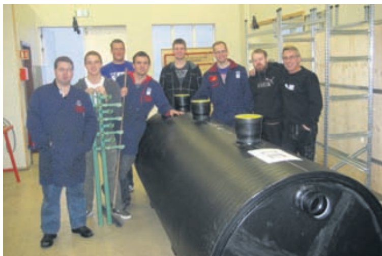
Frá því að farið var að útskrifa nemendur úr skólanum með full sveinsréttindi hafa 135 nemar útskrifast. Núna eru 44 nemendur í pípulagninganámi við skólann.

í pípulagninganámi við Iðnskólann í Hafnarfirði, þar af eru 17 nemendur að ljúka námi í vor.